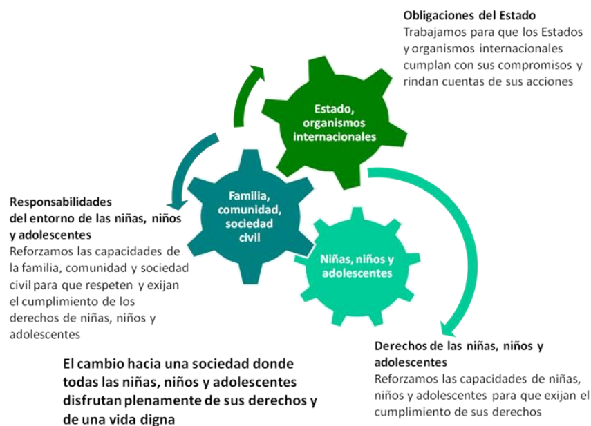
Diagrama 1: El Enfoque de Cambio de Educo

Todos y cada uno de estos actores deben ser, en la esfera que les corresponda, agentes del cambio deseado, mediante acciones directas sobre las carencias y las violaciones de derechos, el refuerzo de los mecanismos institucionales y el de las capacidades de las comunidades y de la sociedad civil. El papel que juegan las niñas, niños y adolescentes, es decir, su grado de implicación y responsabilidades, varía según su estado de desarrollo evolutivo.