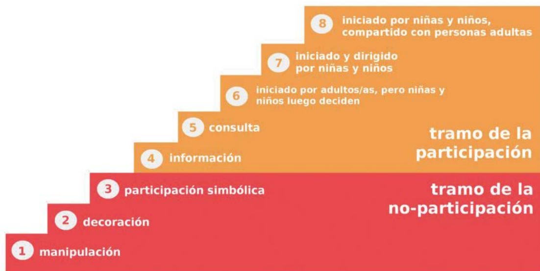
Grafico escalera de hart:

Según la Convención sobre los Derechos del Niño de las Naciones Unidas, los estándares deben ser interpretados dentro del marco de los siguientes principios generales: