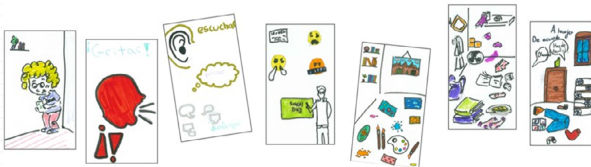
Bocetos de cartas, elaborados por el alumnado del Institut Escola Jacint Verdaguer (Barcelona)

En línea con los objetivos del proyecto, el juego de cartas “¿Y por qué no hacemos algo juntas?” busca fomentar a partir de un enfoque lúdico la reflexión crítica sobre la participación de niños, niñas y adolescentes en cuestiones socioeducativas que les afectan en sus entornos de convivencia cercanos, como son la familia y la escuela, y promover espacios de diálogo y encuentro entre la infancia, la adolescencia y las personas adultas.